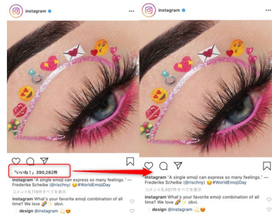
(左：テスト非対象者 右：テスト対象者)

過去にカナダで同様のテストを行っており、今回のテストでは範囲を広げ、日本の他にもオーストラリア、ブラジル、カナダ、アイルランド、イタリア、ニュージーランドでテストを実施中です。